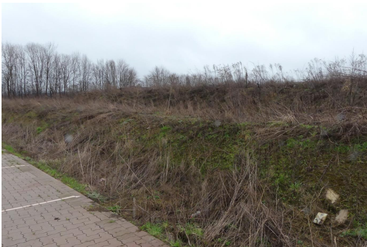
Abb. 3: Wall der nach Zauneidechsen abgesucht wurde