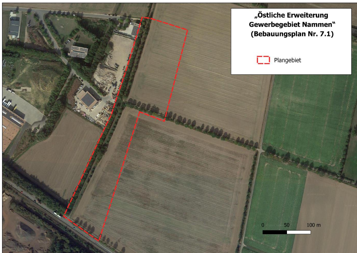
Abb. 1: Luftbild vom Plangebiet

Für die Erfassung der Zauneidechsen wurde die Standardmethode zur Bestandserfassung (Ersterhebung) aus dem Methodenhandbuch zur Artenschutzprüfung in NRW (Aktualisierung 2021) angewandt. Dabei werden potentielle Habitats durch langsames Begehen nach Zauneidechsen abgesucht. Strukturen wie Grassoden, Zwergsträucher, Steine, Totholz oder offene Bodenstellen werden gezielt abgesucht.