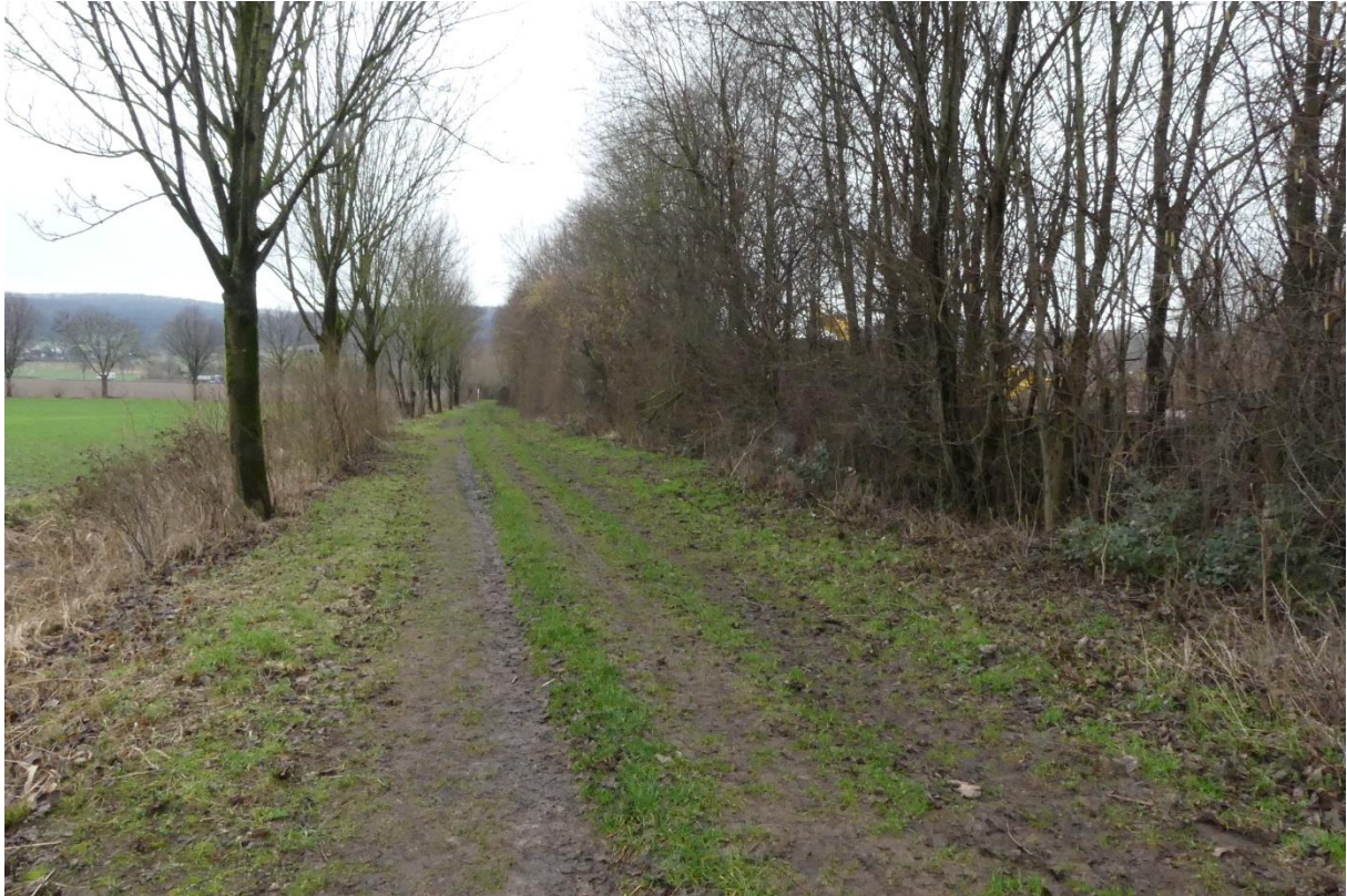
Abb. 4: Weg der nach Zauneidechsen abgesucht wurde